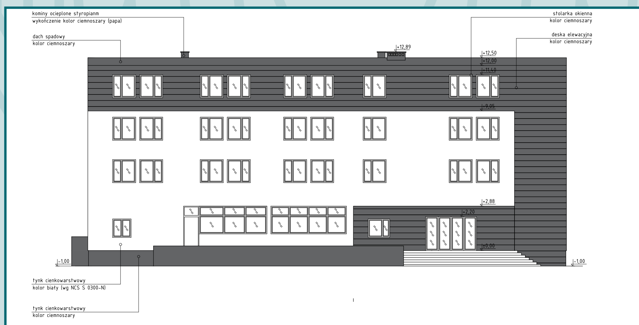
Wizualizacja budynku po remoncie i modernizacji nr 1

Zaproponowano nową szatę wizualną budynku, dzięki której budynek wraz z nowym przeznaczeniem, mógłby stać się wizytówką tego obszaru i inspirować do dalszych tego typu modernizacji.