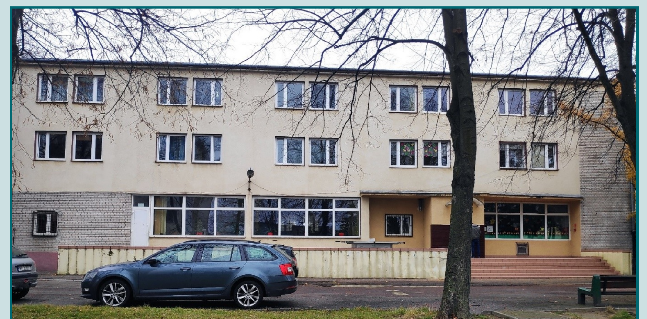
Obecny wygląd budynku